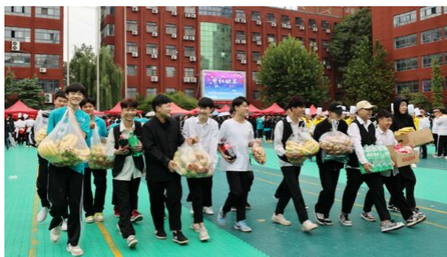
图 16: “欢度中秋 传承经典”主题活动

学校以中国传统节日为载体，开展“弘扬传统文化，唱响文化自信——中国传统节日”系列实践活动。通过开展“元宵节”“端午节”“中秋节”“冬至”等传统节日活动，体验中华优秀传统文化，厚植学生的家国情怀，树立文化自信，培养学生认知传统、尊重传统、弘扬传统的思想观念，增强对中华优秀传统文化传统的认同感和自豪感，夯实文化自信底蕴。