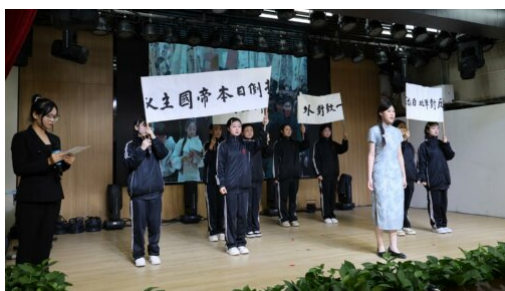
图 6: 2023 年 12 月 9 日 学校组织开展“一二·九”情景剧比赛