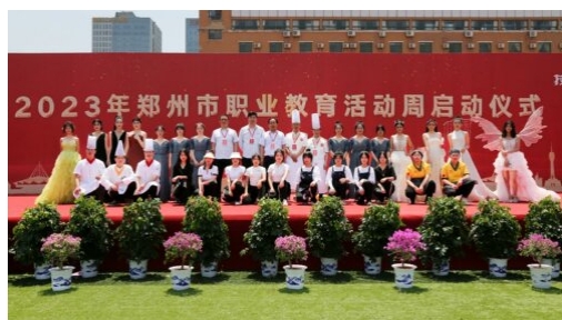
图 11: 学校参加 2023 年郑州市职业教育活动周启动仪式

为贯彻落实党的二十大精神，大力弘扬劳动光荣、技能宝贵、创造伟大的时代风尚，按照《中共河南省委教育工作委员会 河南省教育厅关于做好 2023 年河南省职业教育活动周相关工作的通知》（豫教工委〔2023〕91 号）要求，5 月 13 日，由郑州市教育局举办的“2023 年郑州市职业教育活动周启动仪式”正式开幕，我校应邀参加启动仪式并在现场设立展示区。学校通过宣传展板、专业技能演示等多种形式重点宣传学校的教育教学、实训技能以及人才培养等办学特色，集中展示学校职业教育办学成果。吸引了众多家长、学生和参会代表驻足观看、体验、咨询。