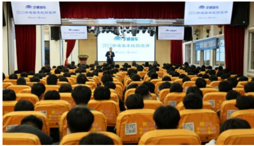
图 22：宇通集团校企合作订单班