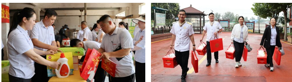
图 33（左）：端午节教职工福利发放