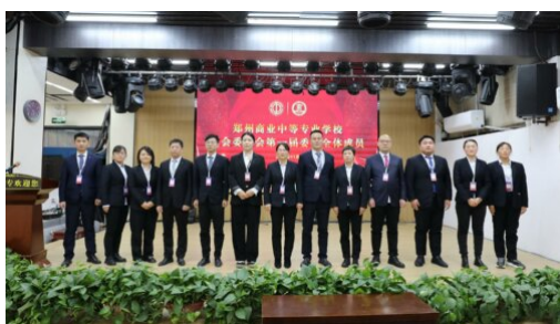
图 32：郑州商业中等专业学校第一届工会委员亮相