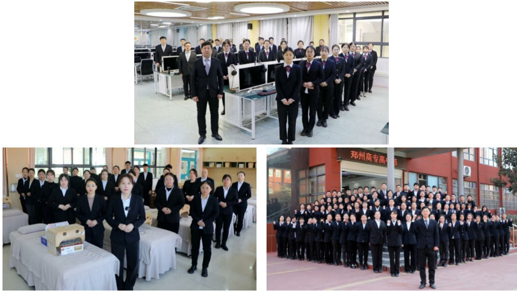
图 27: 名师风采展示 (部分)