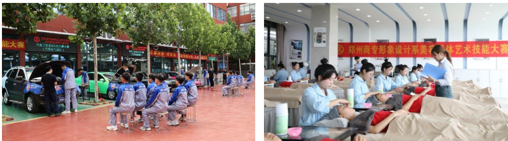
图 13：学校组织开展校级技能竞赛（部分）