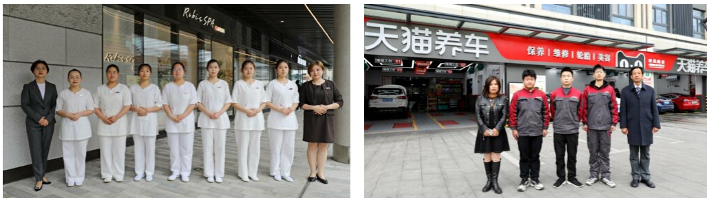
图 25：学校老师深入企业，开展实习就业回访工作