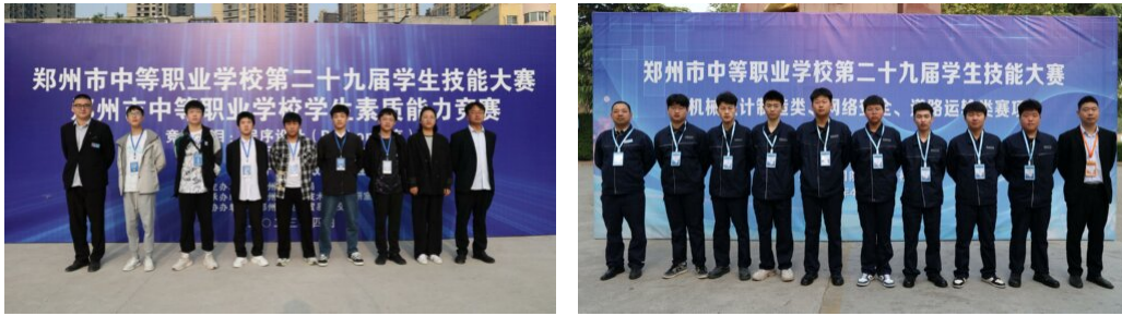
图 12：学校各专业师生参加省、市级技能竞赛（部分）