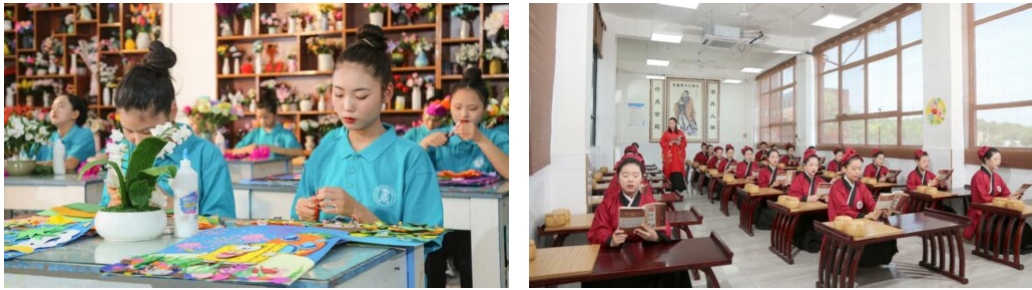
图 15: 陶艺、面塑、剪纸等特色人文课程展示（部分）