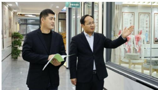
图 8：严格落实课堂巡查制度，查看学生上课情况

学籍管理制度、教学常规检查制度、听评课制度、实训实习管理制度、教师教学质量考核制度、学生评教制度、青年教师培养制度等制度体系，推进学校教学工作的改进与教学质量的提升，在教学质量监控与评价工作中发挥了巨大作用。