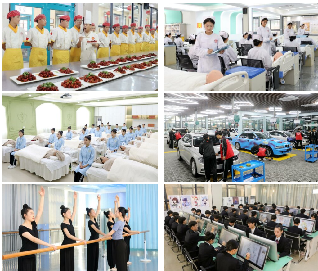
图 7：专业学生上课照片（部分）

的专业建设委员会，进行了广泛而深入的调研，并根据调研结合学校实际情况，融入“1+X”证书标准，按照“底层基础、中层模块、高层方向”原则调整和优化美容美发与形象设计专业群、计算机应用专业群、烹饪专业群、汽车运用工程专业群、艺术教育专业群等品牌专业课程体系。主动适应产业经济升级的根本要求，注重学生实训实践能力培养。