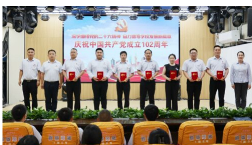
图 2：2023 年 7 月 23 日 建党 102 周年学校优秀党务工作者评选