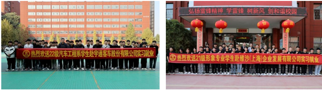
图 24：各系部学生赴企业实习就业