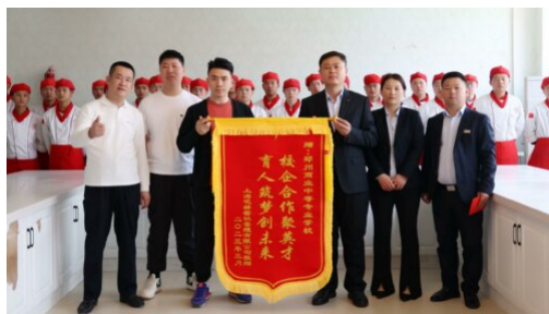
图 21：马记永拉面校企合作订单班