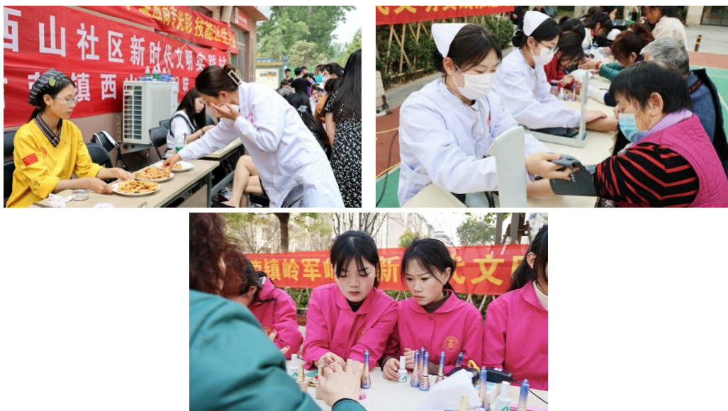
图 14：学校积极组织各专业学生参加社区志愿服务活动

为学习贯彻落实习近平总书记关于青年工作的重要思想，发挥共青团实践育人功能，构建共青团参与社区治理人员、项目、阵地、资源“四位一体”工作模式，2023年，学校依托优质教育资源，深入社区组织开展“我为民服务办实事”系列志愿服务活动，通过开展“检查身体”“义剪”“卫生清洁”等方式，为地方社区人民带来志愿服务。