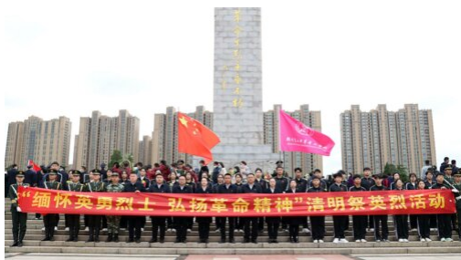
图 4: 2023 年 4 月 5 日 党史学习教育暨清明祭奠英烈活动

扎实推进学校“三全育人”工作体系建设，实施课程思政工程。推进红色育人工程，以党史教育为切入点，以思政课、课程思政、讲红色故事等方式进行思想教育，组织学生参加“红色诗词比赛”“请党放心，强国有我”“清明节烈士陵园祭祀”“庆国庆文艺晚会”等活动。