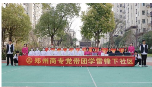
图 1：2023 年 9 月 15 日 学校党带团学雷锋下社区活动

学校党支部在上级党组织及校领导的正确领导下，坚持全面贯彻落实党的二十大精神，以习近平新时代中国特色社会主义思想为指导，坚定扛牢政治责任，牢牢把握“学思想、强党性、重实践、建新功”的总要求，紧紧锚定目标任务，周密安排部署，精心组织实施，坚持把理论学习、调查研究、推动发展、检视整改、解决实际问题五项措施贯通起来，不断推动党建引领学校工作走深走实。党建工作全面落实“党建引领高质量发展，全面落实立德树人”理念，着力工作创新、提质增效，为学校高质量发展提供坚强政治保证。