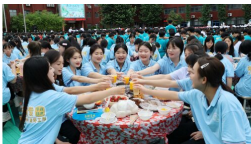
图 17：“粽情端午，万人宴席”主题活动