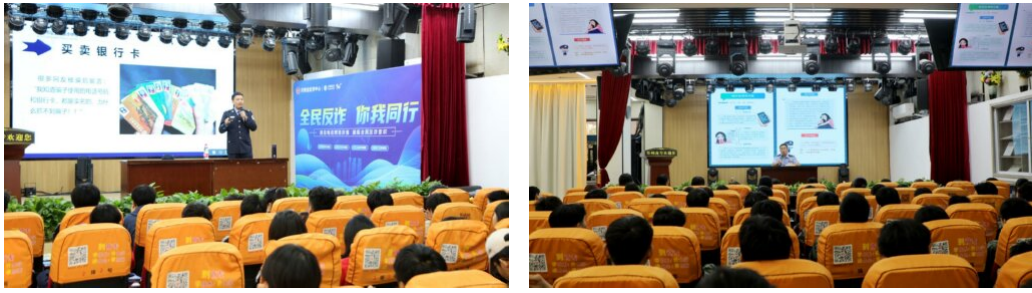
图 29（右）：学校组织开展“校园反诈”主题讲座