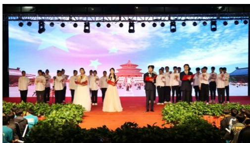
图 5: 2023 年 9 月 26 日 学校组织开展庆国庆文艺晚会

9月26日晚，学校在启智广场隆重举行“学习二十大·共筑中国梦”2023年庆国庆文艺晚会。全校师生共聚晚会现场，载歌载舞欢庆祖国74周年华诞。整场晚会高潮迭起、精彩纷呈，掌声与欢呼声接连不断，点燃了青春最美的华章。不仅展现了商专深厚文化底蕴和多彩校园生活，也进一步激发了全体学生爱国、爱校的意识，让青春之花在全面建设社会主义现代化国家新征程中绽放！