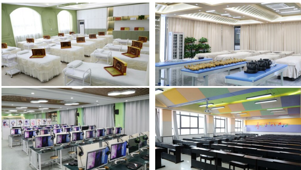
图 26: 各专业硬件设施展示（部分）