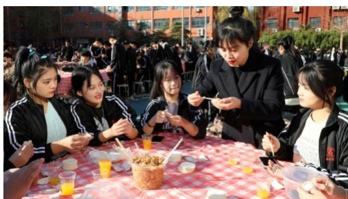
图 18（左）：“饺子飘香 喜迎冬至”主题活动