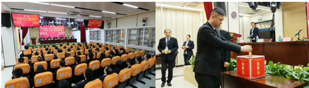
图 31：学校召开工会成立暨第一届第一次会员代表大会

为促进学校和谐健康发展，更好地维护职工的合法权益，推进基层工会民主化、群众化、法制化建设，增强基层工会政治性、先进性、群众性，激发基层工会活力，根据《中华人民共和国工会法》《中国工会章程》等规定，在上级总工会的领导下，学校于2023年11月28日成立了工会委员会、经费审查委员会、女职工委员会。工会的成立，不仅为今后更好的服务广大教职员工提供保障，而且进一步推进学校快速向好发展。