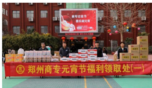
图 19（右）：“欢喜闹元宵 文化共传承”主题活动