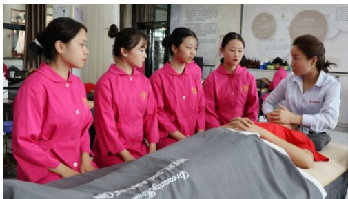
图 20：泰圣荷美容校企合作订单班

为实现“产教融合、校企合作”的基本办学模式，形成“工学结合、知行合一”的共同育人机制，培养“知识型、创新性”高素质应用技能型人才。学校先后与“宇通集体”“泰国圣荷（亚太）化妆品集团”“思妍丽”“东匀”“马记永”“镁连社”等企业强强联合，开设“校企订单班”，校企双方紧密联系，科学、合理地制定教学计划、安排教学内容，共同完成实训教学任务，通过校企共建课程和实训资源平台，共享教师和教学资源等，动态嵌入市场急需的行业模块或企业课程，实现课程内容与职业（行业）标准、教学过程与生产流程、生产工艺的全面对接，推进企业参与人才培养全过程，实现校企协同育人。